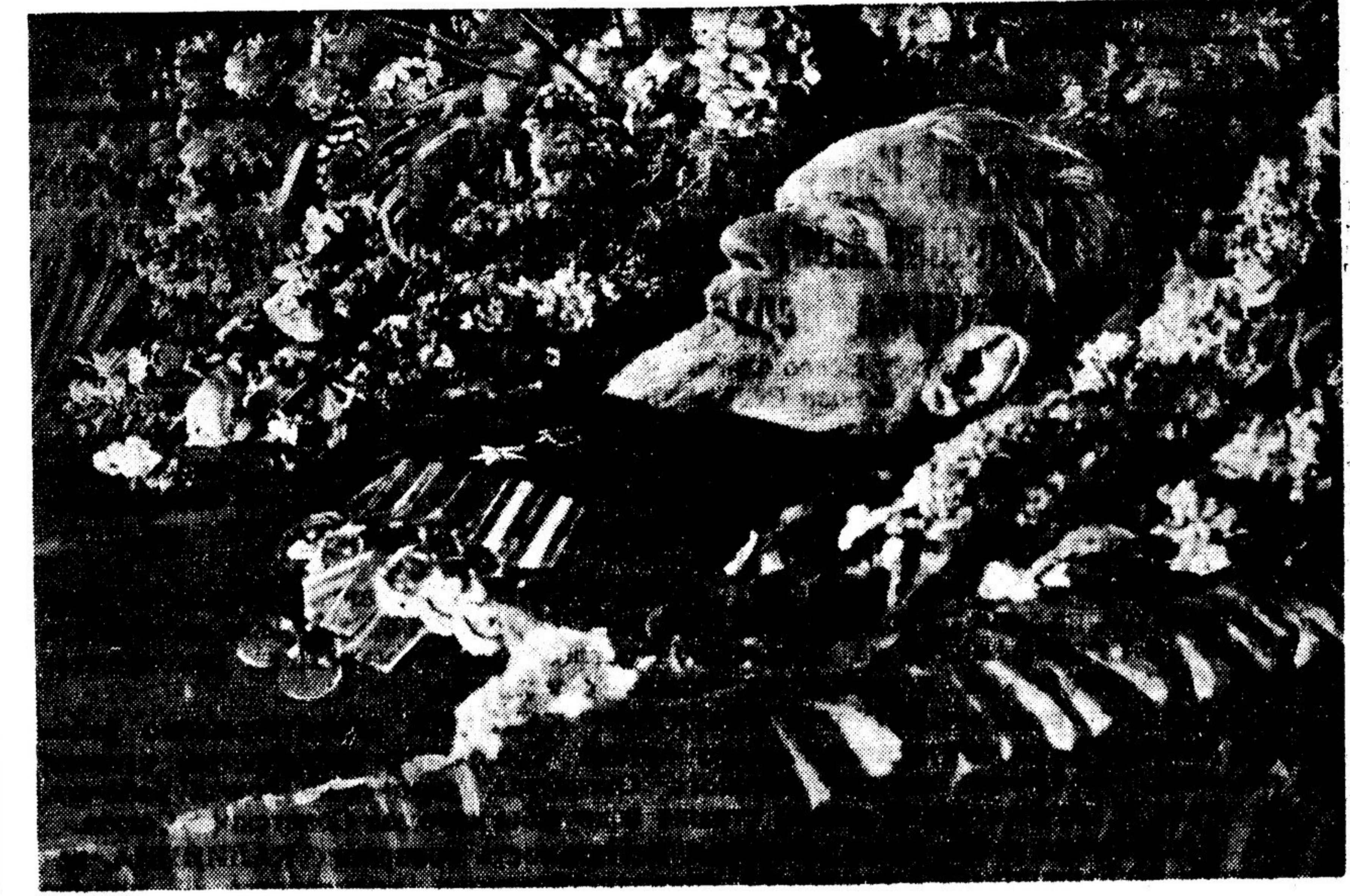
Михаил Иванович Калинин в гробу.

Председатель правительственной комиссии по организации похорон тов. А. Н. Косыгин объявляет траурный митинг, посвященный памяти М. И. Калинина, открытым.